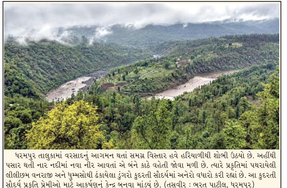
ધરમપુર તાલુકામાં વરસાદનું આગમન થતાં સમગ્ર વિસ્તાર હવે હરિયાળીથી શોભી ઉઠ્યો છે. અહીંથી પસાર થતી નાર નદીમાં નવા નીર આવતાં એ બંને કાંઠે વહેતી જોવા મળી છે. ત્યારે પ્રકૃતિમાં પથરાયેલી લીલીછમ વનરાજ અને ધુમ્મસોથી ઢંકાયેલા ડુંગરો કુદરતી સૌંદર્યમાં અનેરો વધારો કરી રહ્યાં છે. આ કુદરતી સૌંદર્ય પ્રકૃતિ પ્રેમીઓ માટે આકર્ષણનું કેન્દ્ર બનવા માંડ્યું છે.

ધમડાચી નેશનલ હાઈવે પર બનેલા નવા ઓવરબ્રીજ પર રસ્તાનો ભાગ બેસી જવાના કારણે વધુ એક અકસ્માત સર્જાયો હતો. હોન્ડા એકિટવા મોપેડ પર સવાર વૃદ્ધ દંપતીના મોપેડનું ટાયર ખાડામાં પડતાં બાઈક અને દંપતી રોડ પર પટકાતાં ઈજાગ્રસ્ત બન્યા હતા. ઉલ્લેખનીય છે કે ગત રોજ પણ આ જ સ્થળે અન્ય એક મોપેડ ચાલકને અકસ્માત નડ્યો હતો. બીજી તરફ ભારે વરસાદના કારણે મુંબઈથી સુરત જતા માર્ગ પર પણ મોટો ખાડો પડતાં હાલ વાહનોની અવરજવર બંધ કરી દેવામાં આવી છે.