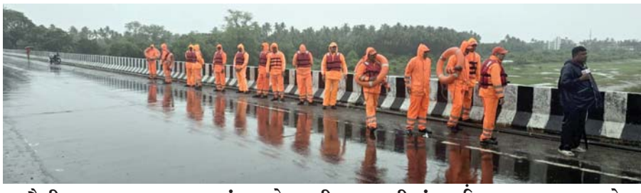
સૌથી વધુ વલસાડ તાલુકામાં સવારે ૬ થી ૧૦ સુધીમાં ૭ ઈંચ વરસાદ ખાબક્યો