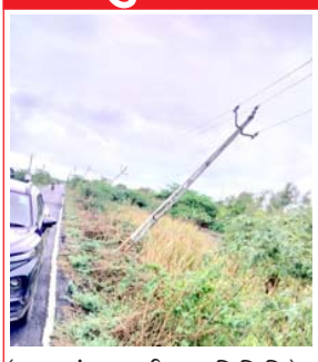
(દમણગંગા ટાઈમ્સ પ્રતિનિધિ) ગણદેવી, તા. ૦૩ : ગણદેવીના કાંઠા વિસ્તારમાં છાપર ગામથી માછીયાવાસણ અને ભાગાતળાવ

જતા મુખ્ય માર્ગ પર દક્ષિણ ગુજરાત વીજ કંપની લિમિટેડ ના અનેક વીજપોલ જોખમી રીતે એકતરફ નમી પડ્યા છે. લાઈનબંધ નમવા આ થાંભલાઓની ડામાડોળ સ્થિતિ ઈશર ચલા મેં, કિધર ચલા... જેવી થઈ ગઈ છે, જે વાહનચાલકો અને સ્થાનિકો માટે ગમે ત્યારે મોટી હોનારત સર્જી શકે તેમ છે. જીઈબી તંગ દ્વારા વહેલી તકે આ વીજપોલનું યોગ્ય સમારકામ કરવામાં આવે તેવી લોકમોંગ ઉઠી છે.