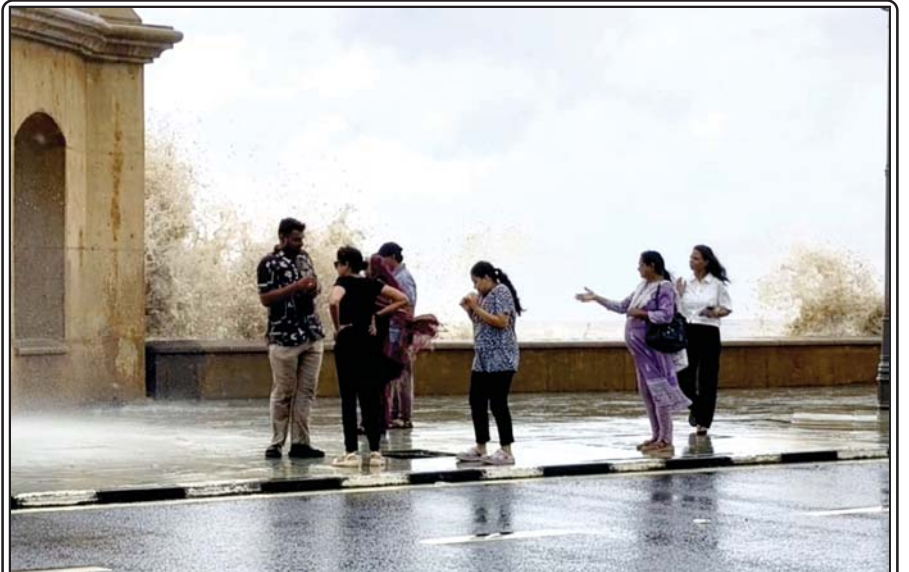
દમણમાં વરસતા વરસાદ, ચારે તરફ છવાયેલી હરિયાળી અને અરબી સમુદ્રના ઊંચા મોજાં પ્રવાસીઓને વિશેષ આકર્ષિત કરી રહ્યા છે. રામસેતુ અને નવા ભારત વિસ્તાર પાસે સમુદ્રના ઊંચા ઊંચા મોજાં જોવા માટે મોટી સંખ્યામાં સ્થાનિક લોકો અને પ્રવાસીઓ ઉમટી રહ્યા છે. પ્રવાસીઓ કુદરતી સૌંદર્યનો આનંદ માણવાની સાથે ફોટોગ્રાફી અને વિડિયોગ્રાફી પણ કરી રહ્યા છે.