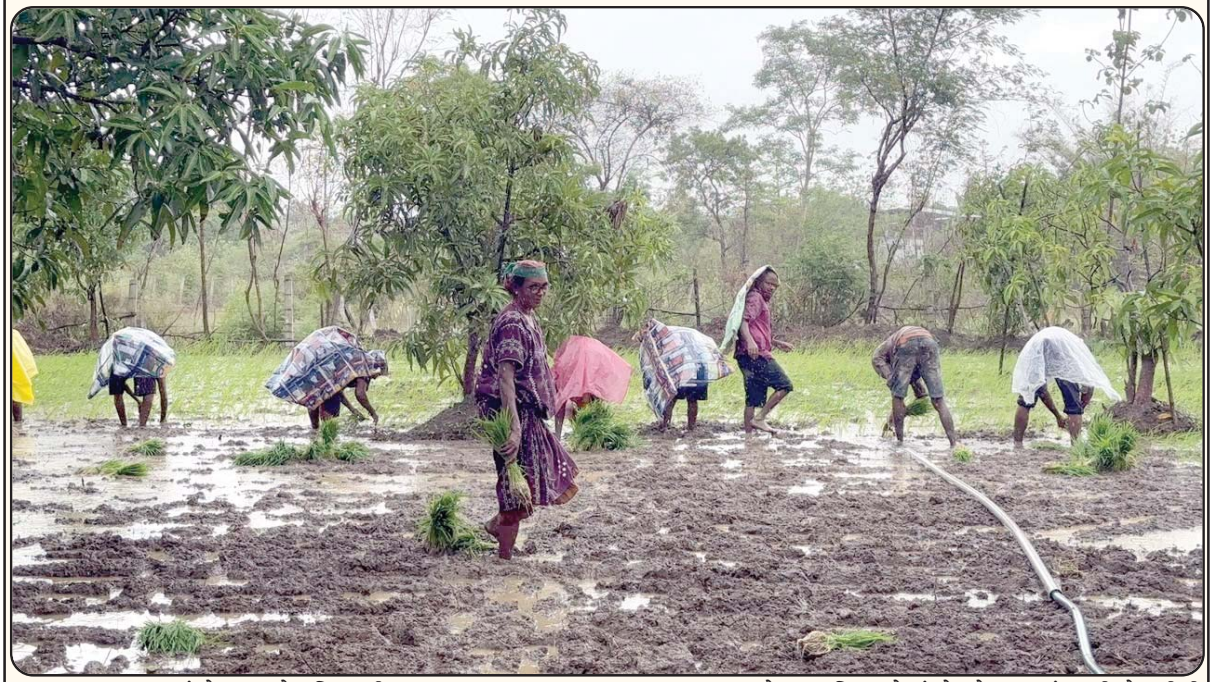
ધરમપુર તાલુકામાં છેલ્લા ત્રણેક દિવસથી ઝરમર વરસાદ વરસતા ધરમપુર તાલુકાના કેટલાક વિસ્તારોમાં ખેડૂતો દ્વારા ડાંગરની રોપણીની કામગીરીનો પ્રારંભ કરવામાં આવ્યો છે. આ વર્ષે ચોમાસાનું આગમન મોડું થતાં ખેડૂતોને જૂન મહિનાના અંત સુધી વરસાદની લાંબી રાહ જોવી પડી હતી. ગત વર્ષે જૂન મહિનાના અંત સુધીમાં તાલુકામાં ૩૨ ઈંચથી વધુ વરસાદ નોંધાયો હતો, જ્યારે આ વર્ષે ૨ જુલાઈ સુધી માત્ર પાંચ ઈંચની આસપાસ વરસાદ નોંધાયો છે. વરસાદની ઘટને કારણે ખેતીની કામગીરી પણ વિલંબમાં રહી હતી. ખેડૂતોનું કહેવું છે કે હવે આગામી દિવસોમાં સારો વરસાદ રહેશે તો રોપણીની કામગીરી વેગ પકડશે અને ખેતી માટે અનુકૂળ માહોલ સર્જશે તેવી આશા વ્યક્ત કરી હતી.

સહિતના ઉચ્ચ અધિકારીઓ પરિસ્થિતિ પર સતત નજર રાખી રહ્યા છે. કંટ્રોલ રૂમ ને સક્રિય કરી દેવાયો છે અને તંત્ર ૨૪ કલાક એલર્ટ મોડ પર છે. પંચાયત, માર્ગ-મકાન, આરોગ્ય અને વીજ કંપની જેવા તમામ લાઈન ડિપાર્ટમેન્ટ્સના અધિકારીઓ અને કર્મચારીઓને હેડક્વાર્ટર ન છોડવા અને સ્ટેન્ડબાય રહેવા કડક આદેશ આપવામાં આવ્યા છે. વહીવટી તંત્ર દ્વારા જિલ્લાના દરિયાકાંઠાના ગામો અને નદી કિનારાના નીચાણવાળા વિસ્તારોમાં રહેતા લોકોને સાવચેત રહેવા ખાસ અપીલ કરવામાં આવી છે. તંત્ર દ્વારા આ વિસ્તારો પર સતત દેખરેખ રાખવામાં આવી રહી છે.