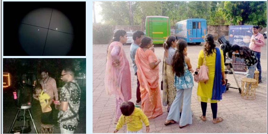
સાયન્સ કોર્નર ડેસ્ક દમણગંગા ટાઈમ્સ, વાપી

જિલ્લા વિજ્ઞાન કેન્દ્ર, ધરમપુર (રાષ્ટ્રીય વિજ્ઞાન સંપ્રદાય પરિષદ - સંસ્કૃતિ મંત્રાલય, ભારત સરકાર) ખાતે તારીખ ૯ જૂન, ૨૦૨૬ના રોજ સાંજે ૭:૦૦ વાગ્યાથી એક વિશેષ 'આકાશ દર્શન કાર્યક્રમ'નું આયોજન કરવામાં આવ્યું હતું. સૌરમંડળના બે સૌથી તેજસ્વી ગ્રહો - શુક અને ગુરુ - સાંજના આકાશમાં એકબીજાની અત્યંત નજીક દેખાયા હતા. ખગોળશાસ્ત્રમાં આ અદ્ભુત ઘટનાને 'ગ્રહોની યુતિ' (Planetary Conjunction) કહેવામાં આવે છે. પૃથ્વી પરથી જોતાં આ બંને ગ્રહો કંઈક રાશિમાં સ્થિત હોવાથી તેમની વચ્ચેનું દેખીતું કોણીય અંતર માત્ર આશરે 1°૦૦' જેટલું જ હતું, જેના કારણે