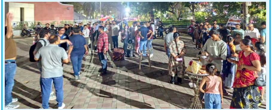
સાયન્સ કોર્નર ડેસ્ક દમણગંગા ટાઈમ્સ, વાપી

૯ જૂન ૨૦૨૬ ના રોજ થયેલ ગુરુ અને શુકની યુતિ લોક વિજ્ઞાન કેન્દ્રની બિગ બેંગ એસ્ટ્રોનોમી ક્લબ ખાતે દોઢ કલાકના કાર્યક્રમમાં લગભગ ૨૫૦૦