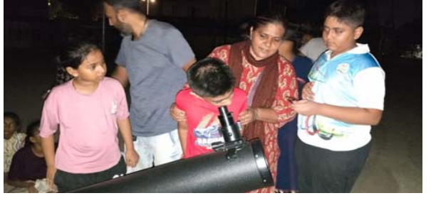
સાયન્સ કોર્નર ડેસ્ક દમણગંગા ટાઈમ્સ, વાપી

આ વર્ષે દેખાતા સૌથી આકર્ષક ખગોળીય દર્શનોમાંનું એક માનવામાં આવે છે.